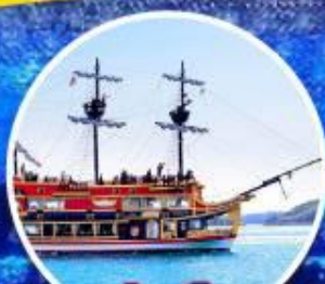
ล่องเรือ คาโกชิมะ เอสพานา