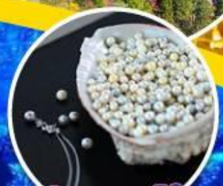
ประสบการณ์ทำ เครื่องประดับจากหอยมุก