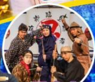
พิพิธภัณฑ์ นินจาอิงะ