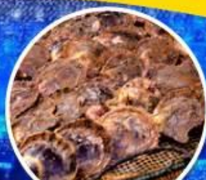
เมนูหอยนางรม สดจากทะเลแบบไม้อื่น