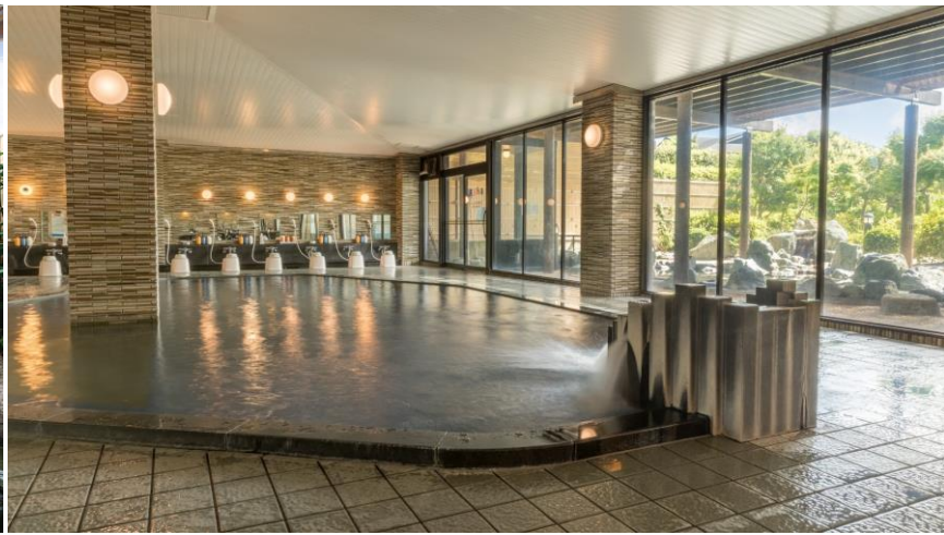
พักค้างแรม ณ โรงแรม Royal Daiwa Ise-Shima หรือในระดับเดียวกัน