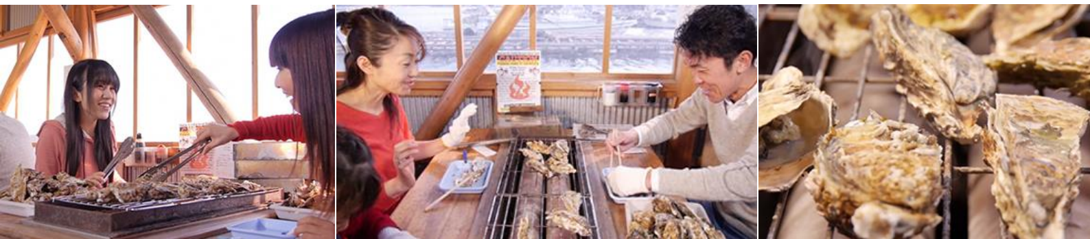
หลังอาหาร นำท่านเดินทางสู่ โกคัตซึราอิเตะ พูราซาโตะ วิลเลจ แล้วนำท่าน เก็บผลไม้ตามฤดูกาล (ส้ม หรือพลับ)