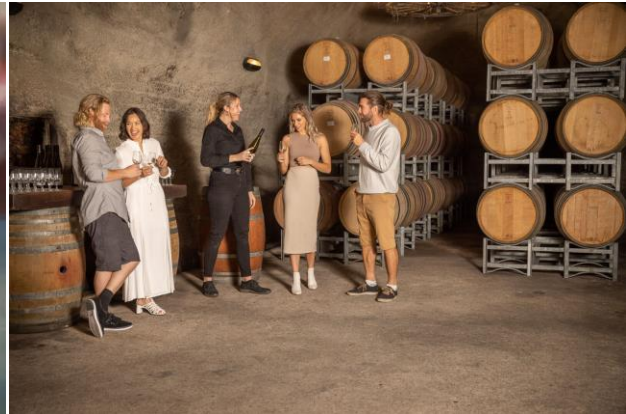
กลางวัน อาหารกลางวัน ณ กิปส์ตัน วัลเลย์ ไวน์เนอร์รี่ บริการท่านด้วยเมนูเวสต์เทิร์น