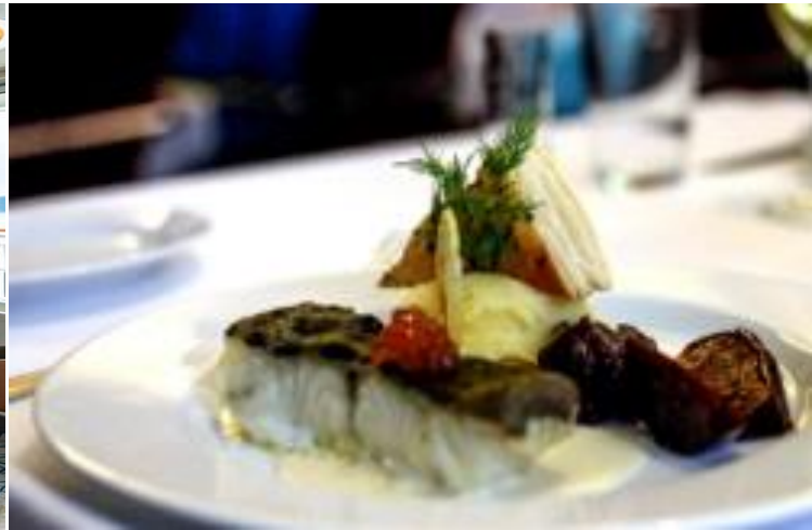
พักค้างแรม ณ บนเรือ Ultramarine