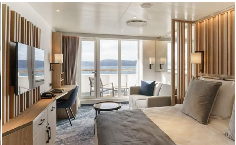
ในยามค่ำคืน เรือจะนำท่านสู่ ทวีปแอนตาร์กติค