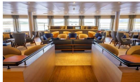
Panorama Lounge and Bar

เรือ Ultramarine ออกเดินทางจากอุซัวยา นำท่านเดินทางสู่อันตาร์กติกา หรือขั้วโลกใต้ ที่น้อยคนนักจะเดินทางมาถึง เรือจะต้องไปตามช่องแคบบีเกิ้ล อันเก่าแก่ ตัดผ่านหมู่เกาะดิเออร์รา เบลฟูเอโก ทางตอนใต้สุดของทวีปอเมริกาใต้ ในวันถัดไปท่านอาจจะอยู่ในทวีปทางใต้สุดของโลกแล้ว