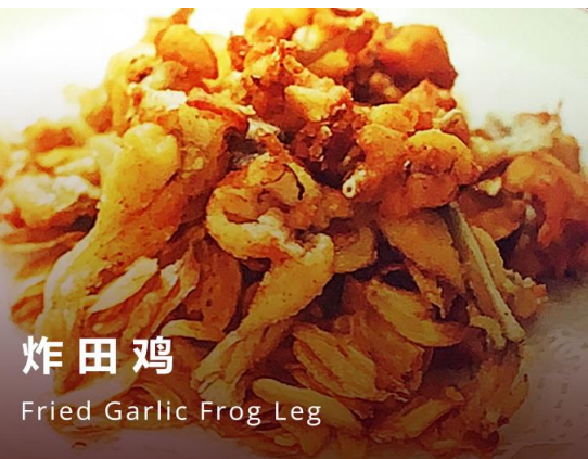
炸田鸡 Fried Garlic Frog Leg